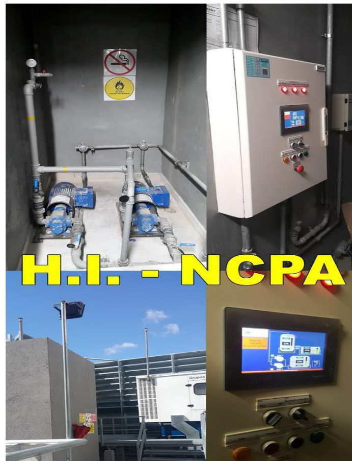
H.I. - NCPA