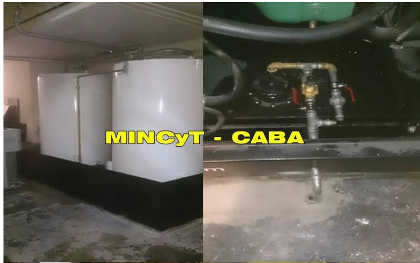
MINCYT - CABA